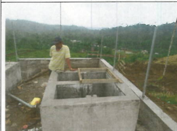
Recorrido por las instalaciones de sistema de agua potable en la comunidad de Naranjito