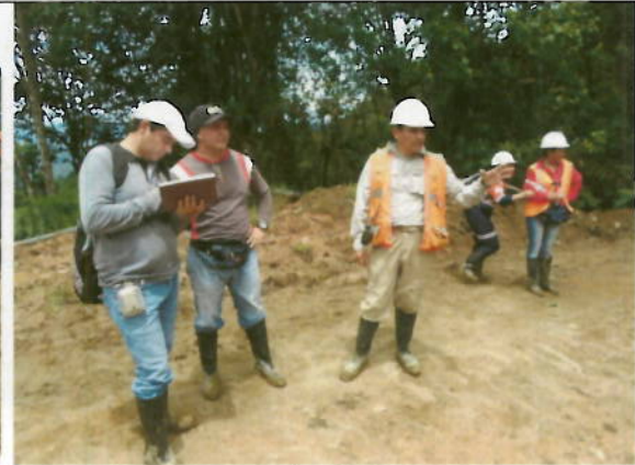
Visita de observación de los representantes del MAE para verificar los trabajos realizados por CODELCO en el Proyecto Llurimagua.