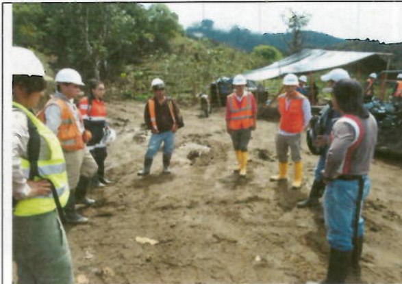
Visita de observación de los representantes del MAE para verificar los trabajos realizados por CODELCO en el Proyecto Llurimagua