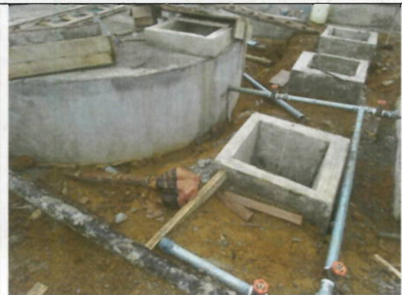
Recorrido por las instalaciones de sistema de agua potable en la comunidad de Naranjito.