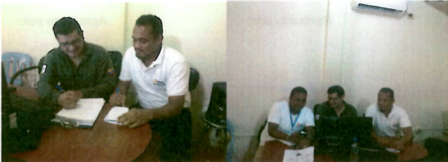
Capacitación en Manejo de Arc Gis 10.1 a los funcionarios de Ministerio de Salud Pública – Convenio Enami EP – MSP