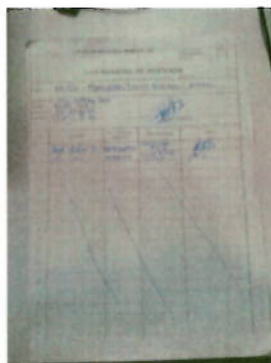
Acta de asistencia al curso