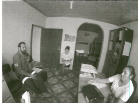
Reunión GAD Vacas Galindo