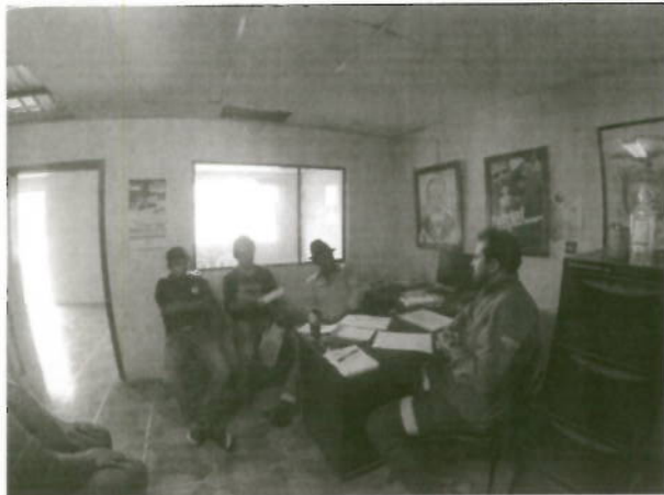
Reunión GAD Plaza Gutiérrez - ENAMI EP