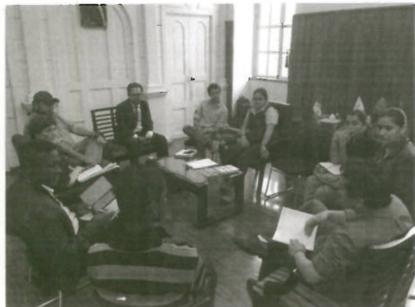
Reunión Comité Provincial proy. Llurimagua