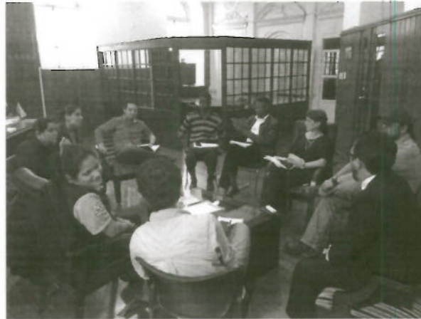
Reunión Comité Provincial proy. Llurimagua