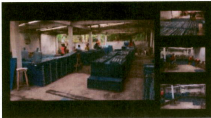
Foto 5.- Bodega con testigos de perforación cerca de la ciudad de Caluma.

Los testigos de perforación que están colocados en cajas de plástico están siendo almacenados en bodega cercana a la ciudad de Caluma. De estos se seleccionarán las muestras para ser enviadas al laboratorio para los respectivos análisis químicos (Foto 5) .