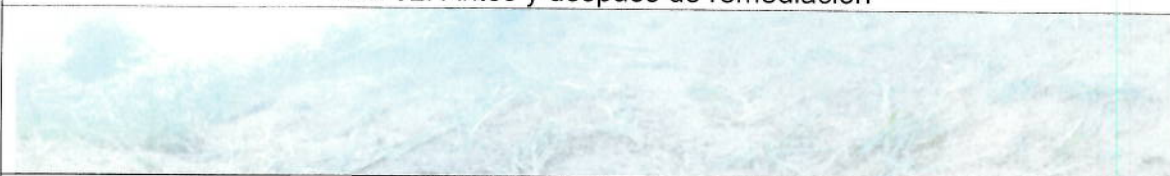
TEL 06: Área remediada