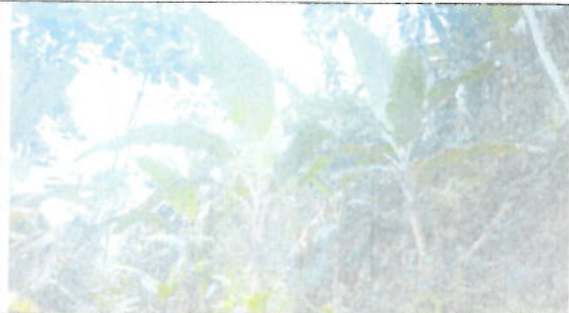
TOR 01 Monitoreo