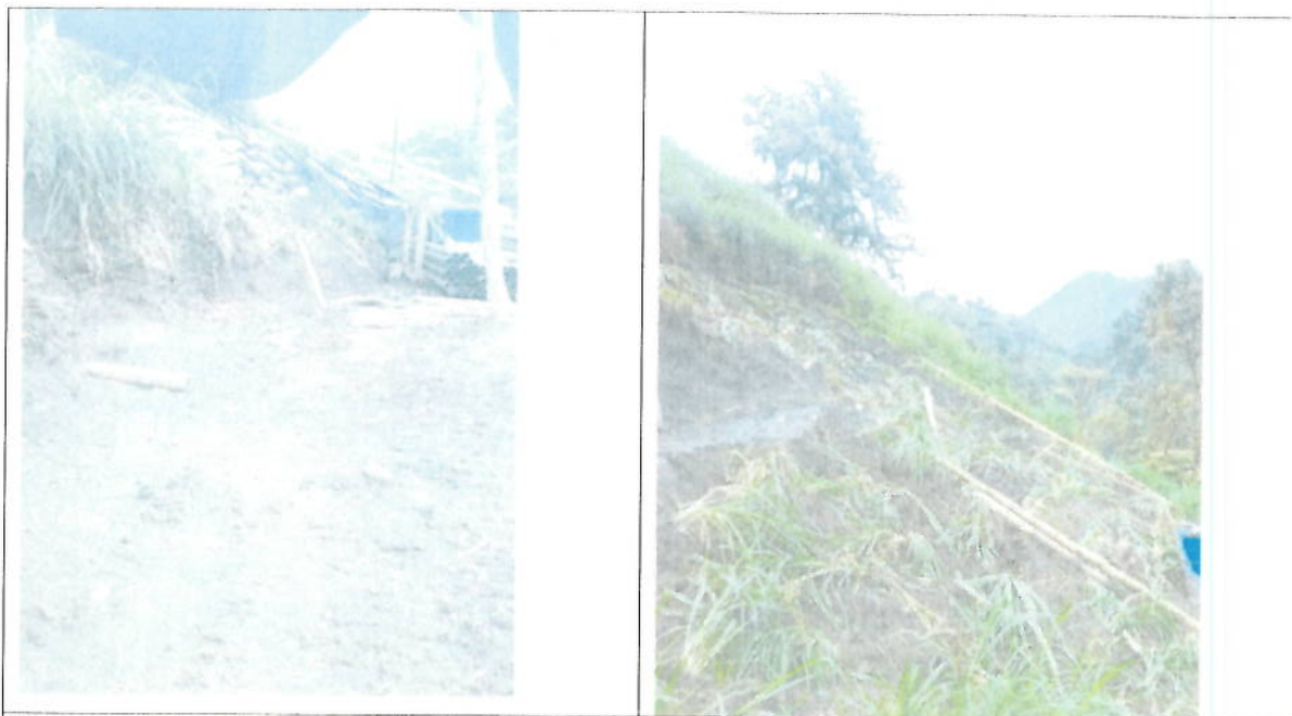
TEL 02: Antes y después de remediación