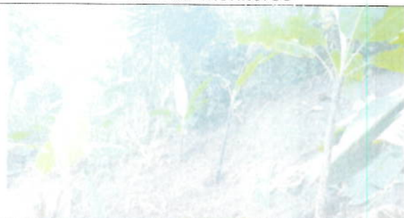
TOR 03 Revegetación