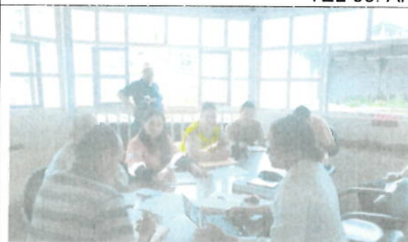
Reunión con autoridades GAD Telimbela