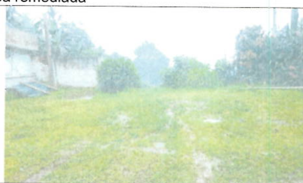
TOR 02 Monitoreo