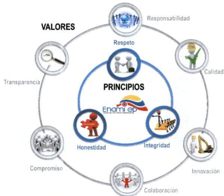
Gráfico No. 1. Relación Principios y Valores ENAMI EP

Considerando que los servidores y trabajadores constituyen un factor clave para el desarrollo empresarial, por la entrega de su conocimiento, experiencia, trabajo y despliegue de actitudes, es de significativa importancia para la ENAMI EP, integrar un conjunto de principios y valores en la toma de decisiones para el cumplimiento de sus objetivos estratégicos y procesos, vinculando ideales y creencias que fortalezcan la gestión empresarial en base a un marco de referencia de actuación individual y colectiva, a través del fomento de la calidad, calidez, responsabilidad, solidaridad y compromiso.